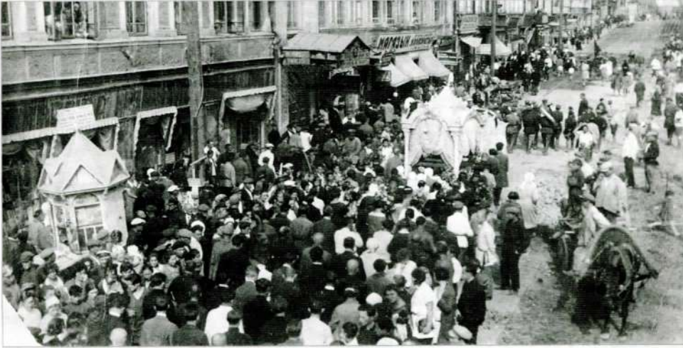
Пахаванне Паўлюка Труса ў Мінску. 1929 г.

ная папка “Песняю славіў жыццё”, прысвечаная паэту, якая ўвесь час папаўняецца новымі матэрыяламі з газет і часопісаў. У гасцёўні можна пазнаёміцца з кнігамі П. Труса 1920–1930-х гг. Захоўваецца тут выданне “Вершы” з аўтографам сястры паэта Веры Адамаўны Трус ад 27 жніўня 1959 г. Трусаўскі фонд бібліятэкі папаўняецца дзякуючы супрацоўніцтву з абменна-рэзервовым фондам Нацыянальнай бібліятэкі Беларусі.