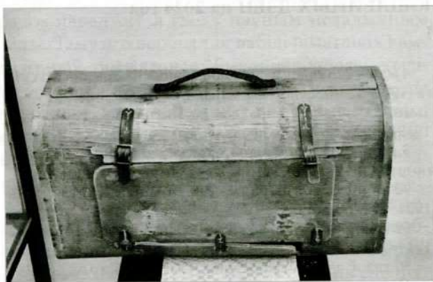
Дарожная скрыня Паўлюка Труса. З фондаў Уздзенскага раённага гісторыка-краязнаўчага музея.

1925 год для П. Труса стаў вельмі актыўным: паэт быў прыняты ў літаратурнае аб'яднанне "Маладняк"; друкаваўся ў часопісах "Маладняк" і "Малады араты", газетах "Беларуская вёска", "Чырвоная змена"; выдаў зборнік паэзіі "Вершы" ў серыі «Кніжніца "Маладняка"»; удзельнічаў у першым з'ездзе літаратурнага аб'яднання, дзе быў абраны ў сакратарыят. У 1926 г. услед за групай пісьменнікаў спрабаваў пакінуць "Маладняк", каб далучыцца да згуртавання "Узвышша", аднак пасля парад Платона Галавача, Міхася Чарота і Міхася Зарэцкага вярнуўся ў арганізацыю. Пасля заканчэння Белпедтэхнікума Цэнтральнае бюро "Маладняка" прапанавала паэту рэдактарскую пасаду ў Мінску, але ён вырашыў з'ехаць са сталіцы. Уладкаваўся на вольную пасаду сакратара гомельскай газеты "Новая де-