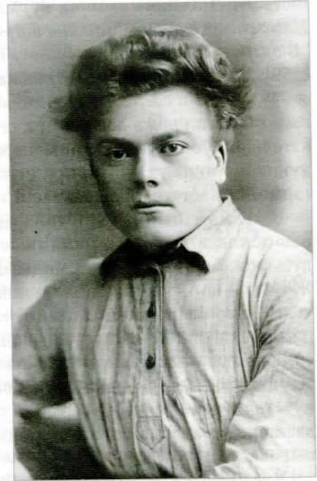
На адвароце здымка дарчы надпіс: «Адаму Бабарэку на добрую памяць ад сябра Усебеларускага аб'яднання паэтаў і пісьменнікаў “Маладняк” П. Труса. Закалосіць свабодным уздымам маладога жыцця акіян. 24/X 25 г.».

Бацькі паэта былі непісьменнымі сялянамі, у сям’і лічылася, што навука дзецям непатрэбная, але Паўлюк цягнуўся да вучобы. У вясковай школе хлопец здзіўляў настаўніка стараннасцю і кемлівасцю. Акрамя паэтычнага таленту